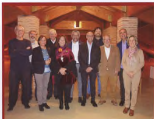
Foto de grup.