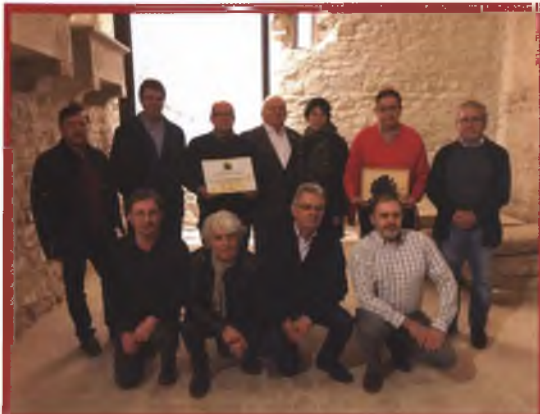
FOTOGRAFIA: Foto de grup.

El dissabte dia 25 de novembre es va celebrar l'acte d'entrega dels premis Gavarres 2017 en el marc del monestir de Sant Miquel de Cruïlles.