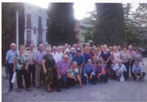
Fotografies davant el santuari de la Gleva.

El diumenge 24 de setembre La Llar va anar d'excursió a Santa Eugènia de Berga per visitar el museu de col·leccionisme MÀGIC MÓN del tren. Us adjuntem dues fotos fent parada a la Gleva on vam esmorzar i dinar.