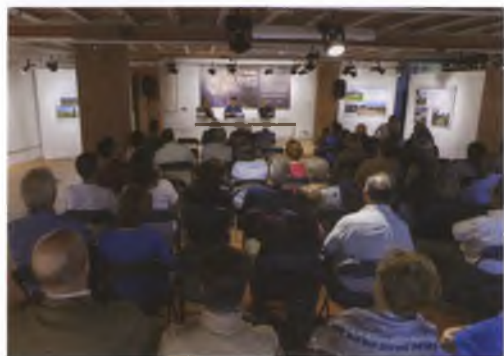
Fotografies presentació. Autor: Jordi S. Carrera

El passat dia 12 de maig a la sala temporal del Museu de la Terrissa de Quart es va presentar el llibre "Montnegre al segle XIV" del historiador Elvis Mallorquí, editat per l'Ajuntament de Quart amb el suport de la Diputació de Girona.