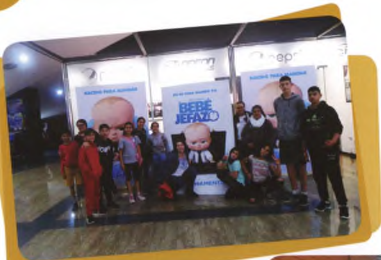
Sortida al cinema: El Bebé Jefazo