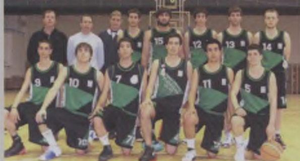
Sots-21 Masculí CAMPIÓ TERRITORIAL. Jugarà la fase final dels Campionats de Catalunya.