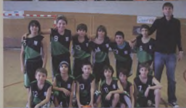
Mini Masculí Tercer classificat del seu grup, Nivell "A", demostrant una gran progressió.