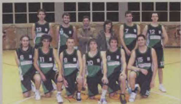
Senior Masculí de 2ª Catalana Quart classificat i accés a les fases d'ascens per pujar a 1ª Catalana.

Aquesta temporada és de les que es pot considerar d'EXCEL·LENT. Si a principis de temporada es procedia a crear un projecte-una il·lusió, aquesta s'ha complert, amb totes les expectatives.