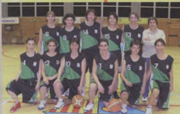
Senior Femení de 3ª Catalana. SOTS-CAMPIÓ i accés a les fases d'ascens per pujar a 2ª Catalana.