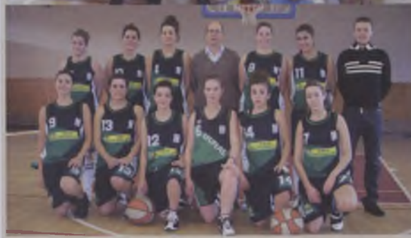
Junior Femení Territorial Equip nou, format aquest any amb jugadores provinents de diferents equips que han competit a Nivell "A". S'han acoplat perfectament, llàstima de les lesions.