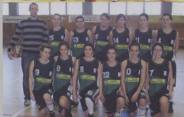
Junior Femení Interterritorial Tercer classificat i accés a les fases que donen dret a participar als Campionats de Catalunya.