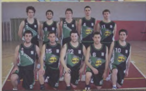
Sots-25 Masculí SOTS CAMPIÓ TERRITORIAL.