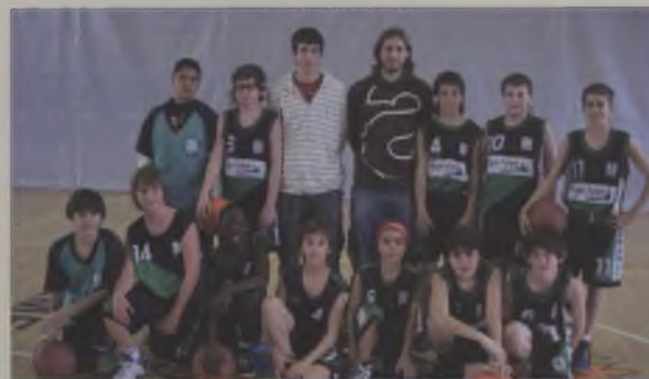
Pre-Infantil Masculí Quart classificat del seu grup. Han competit a Nivell "A".