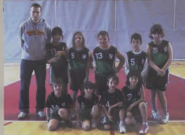
Escola de bàsquet Han participat en diverses trobades d'escoles. S'ha apuntat força mainada.

En total, 10 equips, més de 120 jugadors/es que han competit i s'han divertit jugant a Bàsquet.