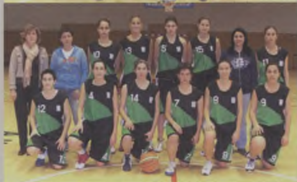
Senior Femení de 2ª Catalana Tercer classificat i accés a les fases d'ascens per pujar a 1ª Catalana.