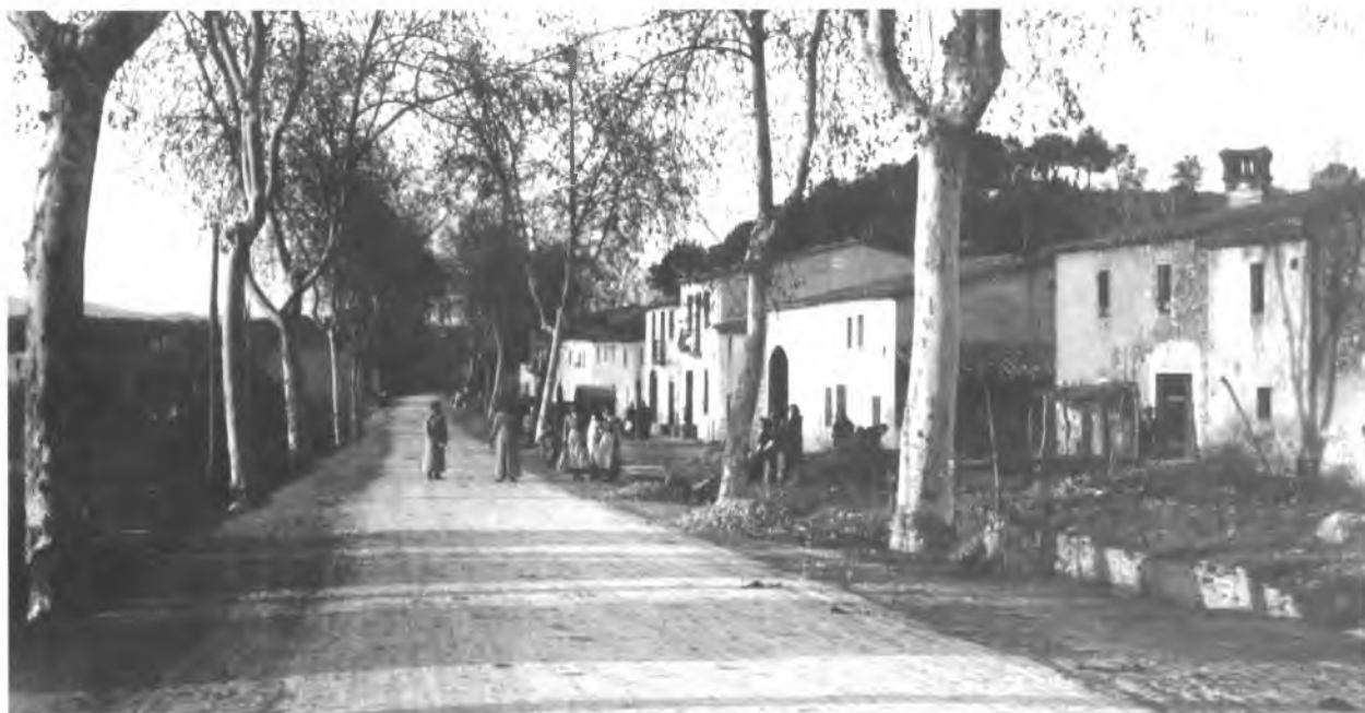
Ctra. de Girona al seu pas per el nucli urbà de Quart.

Diario de Gerona, 28 de novembre de 1933.