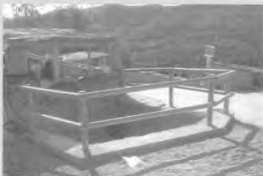
Font del Montnegre

Les obres a la Font de Montnegre van consistir en la neteja de vegetació del fons de la bassa i pavimentar-lo. També es va realitzar una petita aigüera per recollir l'aigua de la font, es va canviar la porta de la font i es va construir una tanca de fusta de protecció perimetral. A la Font de Sant Dalmau es va condicionar i netejar l'entorn d'aquest espai natural, es va donar més amplada a la passera de fusta i s'hi van col·locar unes baranes de fusta. Finalment, a Sant Mateu de Montnegre es va restaurar el mur de pedra perimetral de la zona d'aparcament i es va netejar l'entorn de vegetació.