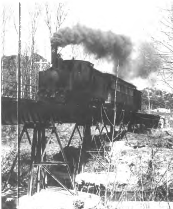
El Carrilet al seu pas per el pont sobre el riu Onyar.