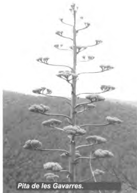
Pita de les Gavarres.