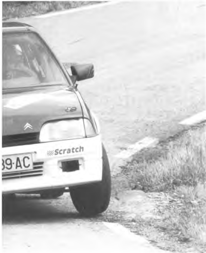
100 Viratges de Manresa, la primera cursa de l'Open Catalunya