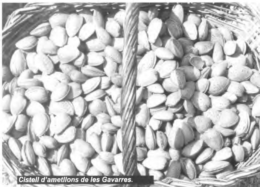
Cistell d'ametllons de les Gavarres.