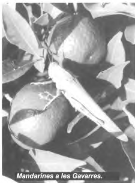
Mandarines a les Gavarres.