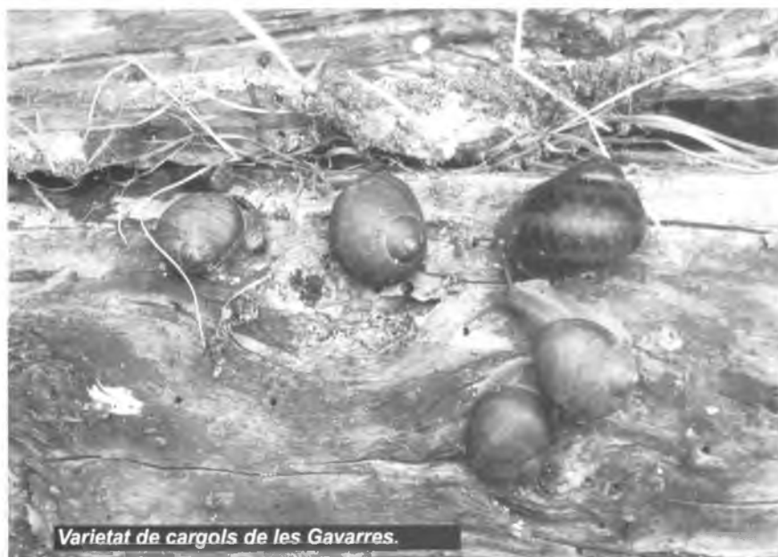
Varietat de cargols de les Gavarres.

El Ple adopta, entre d'altres, els següents acords: