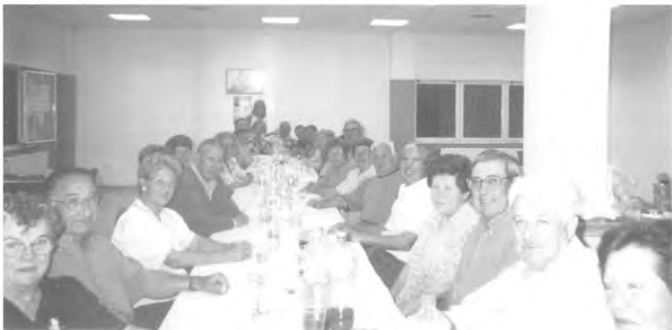
Jubilats de Quart en un àpat celebrat al Local Social.