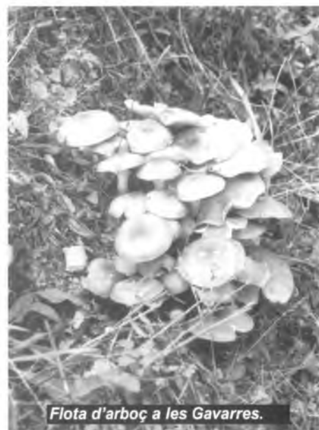
Flota d'arboç a les Gavarres.