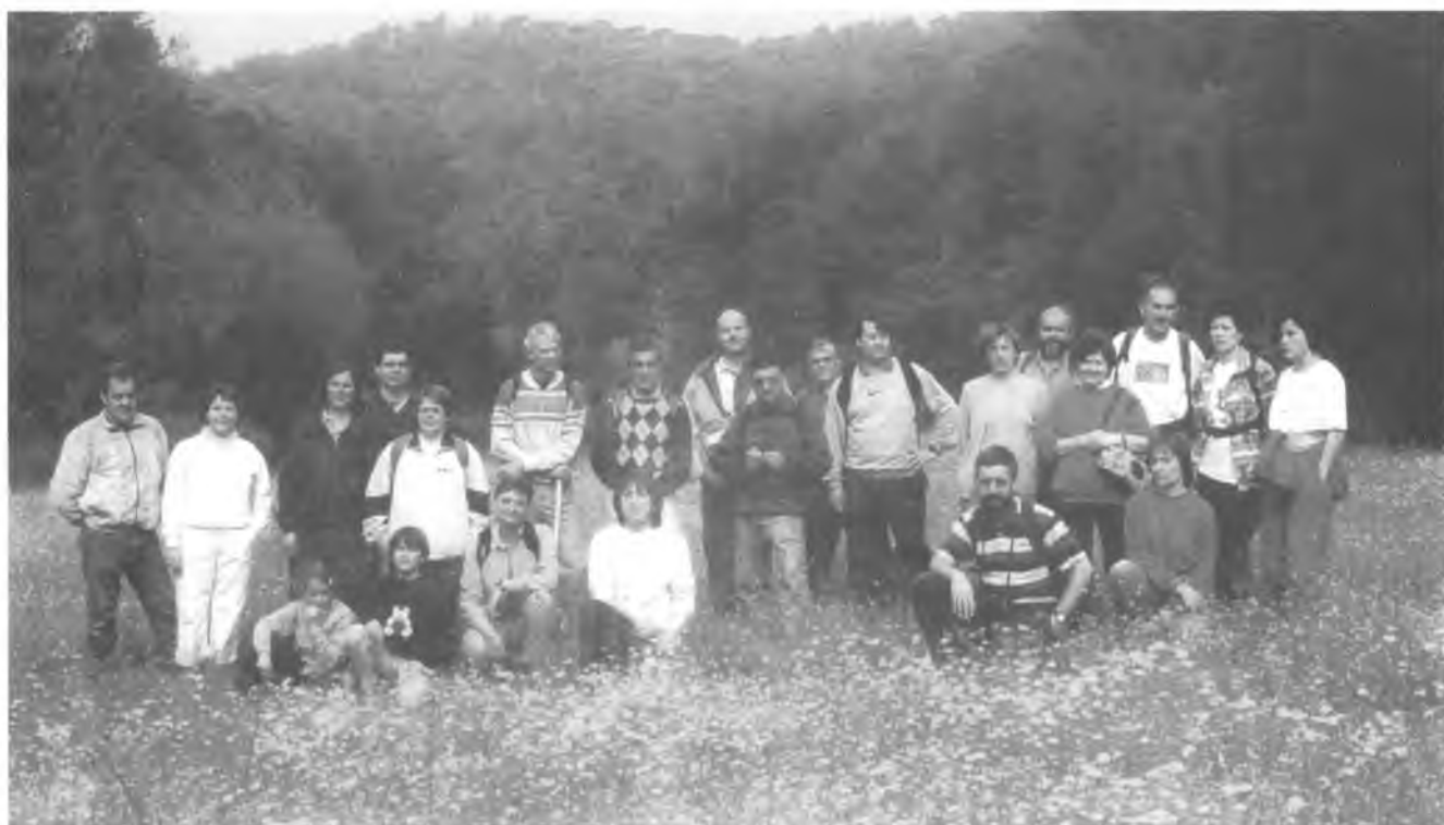
Dia 29-49-2002 Mes4? Excursió a la Vall del Celrà.