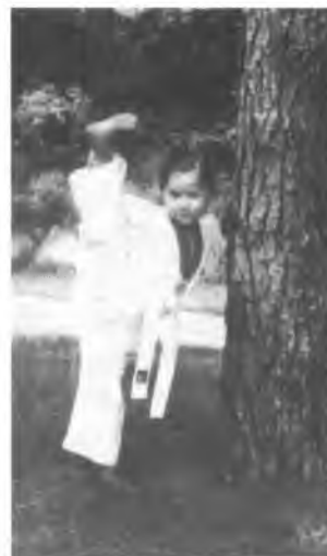
Un nen i una nena practicant el taekwondo.