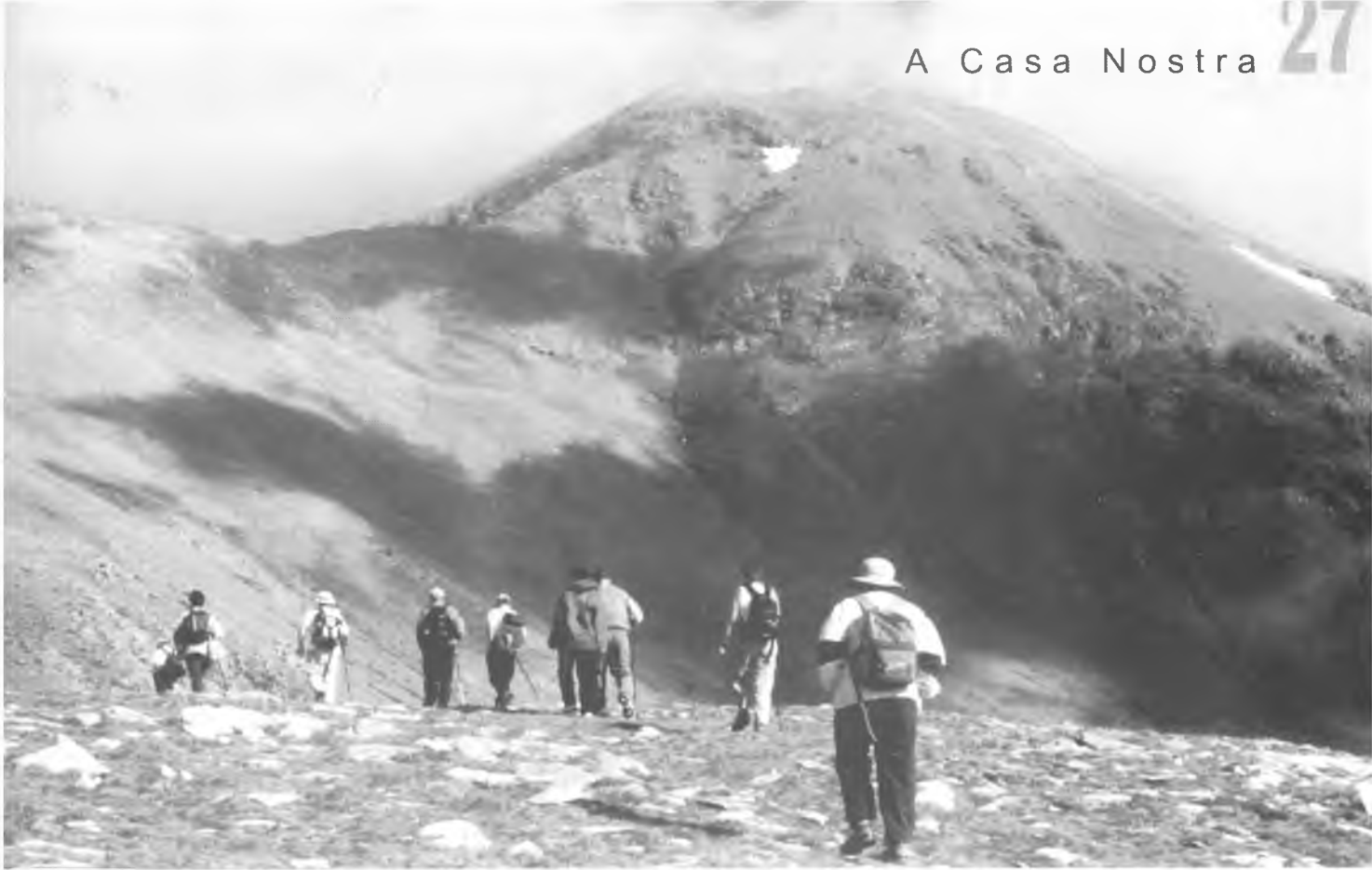
Dia 30-6-2002 Sortida al Puigmal (2.913 m).