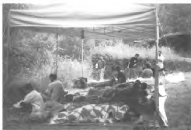
Dia 22-6-2002 Sortida nocturna a la Vall Fetgere.

Itinerari: Can Mascort, Vall del Celrà, Creu de Mas Montalt, Castanyeda de Mas Montalt, Vall Fetgere, Can Marcó i Can Mascort.