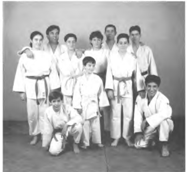
Un grup de joves practicants de judo amb el seu professor.

Activitats eminentment pedagògiques i formatives. Ideal per a nens/es de 5 a 15 anys. Donada la dispersió d'edats dels nens/es s'establiran 3 grups: