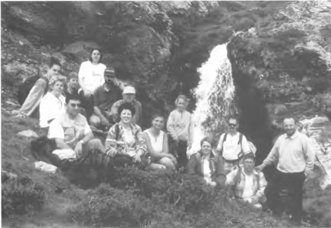
Dia 30-6-2002 Sortint de Font Alba.

taran nades i s'esmorzarà a la vora de les Roques de Mal Pas. Les persones interessades a fer aquesta sortida han d'avisar a l'Associació Excursionista abans del dia 17 de desembre.