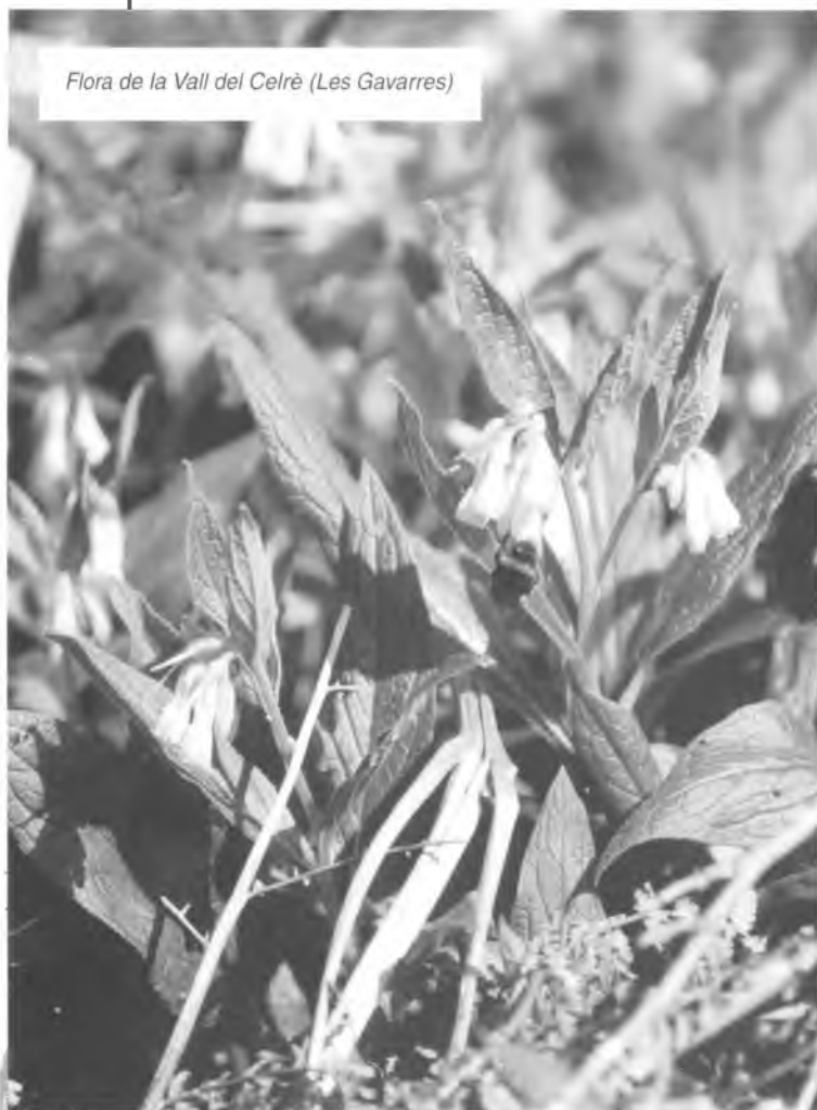
Flora de la Vall del Celrà (Les Gavarres)