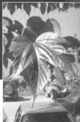
Fulla de morera.