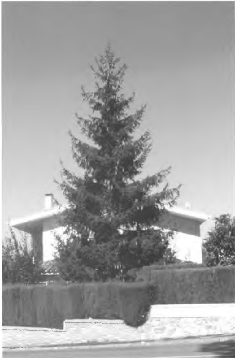
Bonic exemplar d'arbre de Nadal ( Picea excelsa ).

de no dessagnar-la. L'experiència em diu que si es poda tard, entrada en saba, pateix molt i pot aturar el seu creixement, amb els inconvenients del làtex que embruta l'escorça i s'enganxa a les eines i mans del podador. Cal una poda enèrgica anual, la necessita per obtenir bones fulles i pocs fruits.