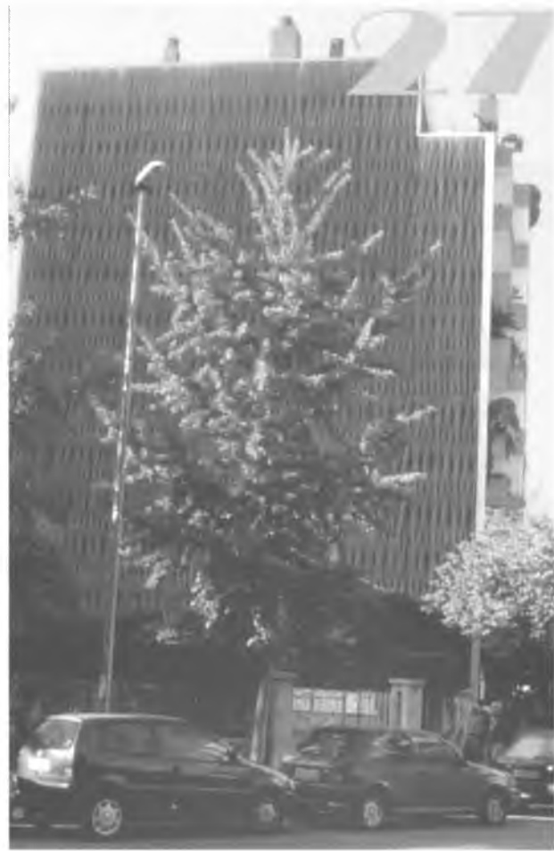
Bell exemplar de Ginkgo Biloba al carrer de la Creu de la ciutat de Girona.

Els seus fruits, les mores, de gust fat -només interessants per als tafaners- i color blanc rosat (de vegades violàcies), maduren al juliol, prové de Xina i es troba naturalitzada a l'Europa meridional. Resisteix el fred fins a -20° C, la sequedat i les terres calcàries i salines, encara que si li donem humitat i bona terra... més que millor. De creixement lent i llarga vida, amb fusta de qualitat semblant a la de l'acàcia, pertany a la família de la figuera i produeix un làtex (llet) que plora en ser ferida. A causa d'això, convé podar-la aviat, amb saba parada, per tal