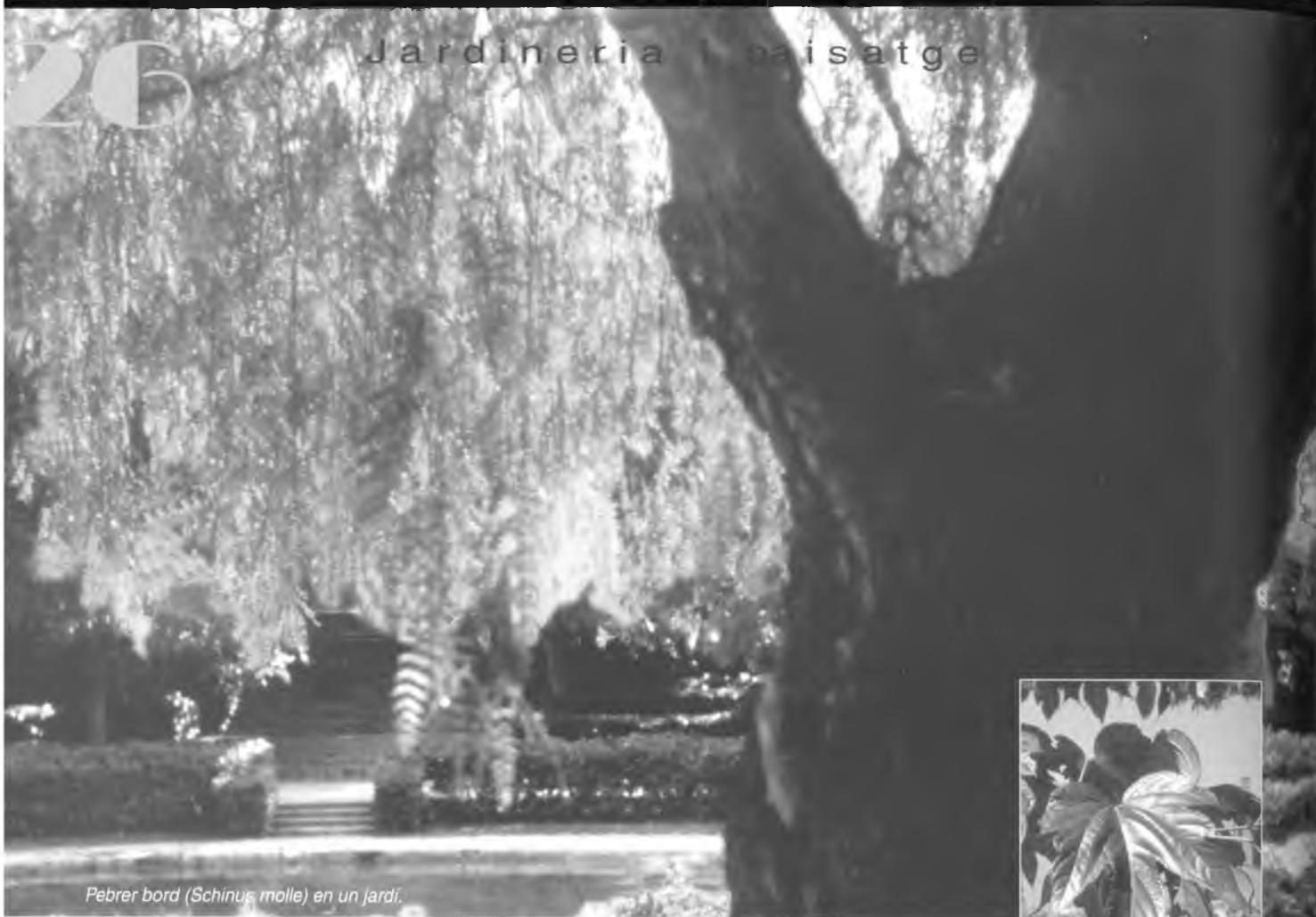
Pebre bord ( Schinus molle ) en un jardí.