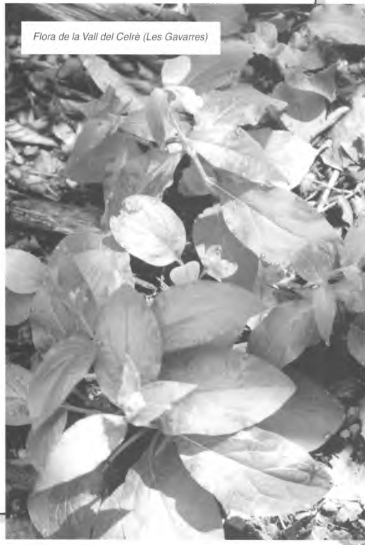
Flora de la Vall del Celrà (Les Gavarres)