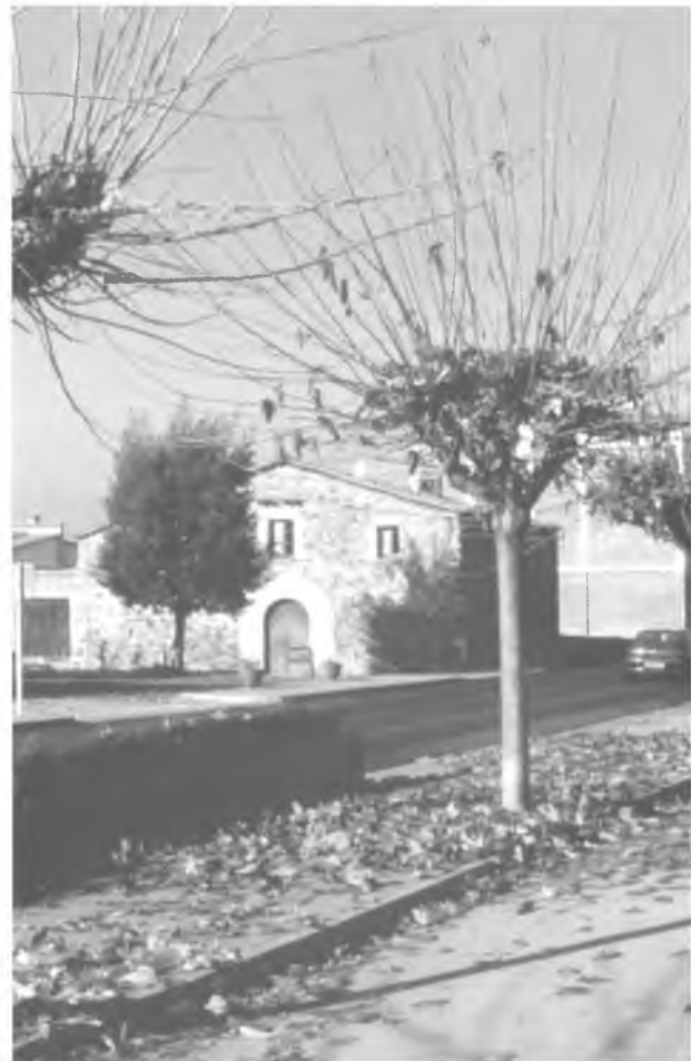
Morera ( Morus alba ) després de la glaçada que va fer la nit del 4 al 5 de desembre de l'any passat.