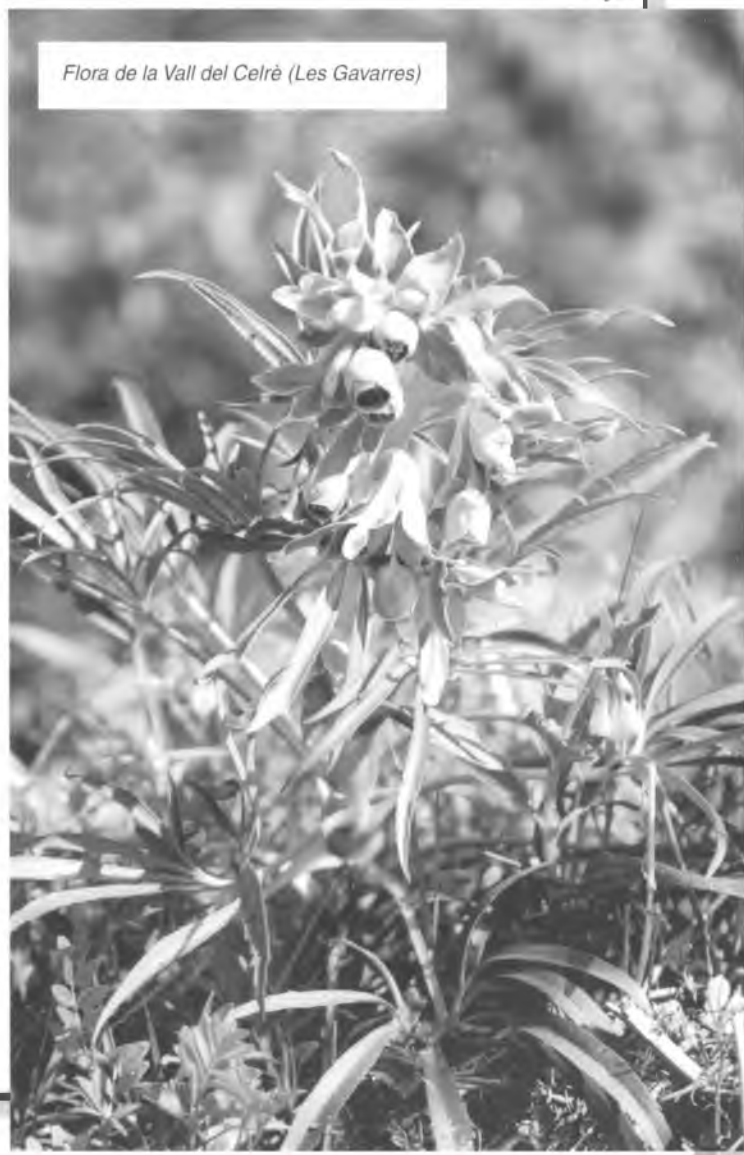
Flora de la Vall del Celrà (Les Gavarres)

Després de declarar el caràcter urgent de la sessió, el Ple acorda aprovar provisionalment la modificació puntual de les Normes Subsidiàries de Quart a l'àmbit del sector 2 de l'Església, redactada per la Unitat de Planejament de l'Institut Català del Sòl (Incasol), per tal d'incloure l'ús d'habitatge plurifamiliar i augmentar la densitat, i sotmetre l'expedient a informació pública pel termini d'un mes perquè es puguin presentar reclamacions i al·legacions. L'alcalde explica que aquesta modificació s'aprova perquè l'Ajuntament de Quart i l'Incasol desenvoluparan la promoció de sòl residencial del Pla Parcial del sector de l'Església i en el 10% de l'aprofitament mig del sector, el qual es repartirà un 5% a favor de l'Ajuntament i un 5% a favor de l'Incasol, es construiran habitatges socials, tot i que encara no està determinat si seran de lloguer o venda.