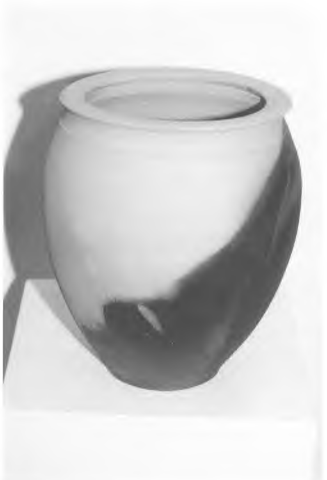
Premi Emília Xargay