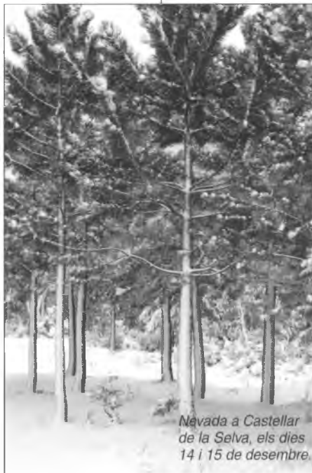
Nevasca a Castellar de la Selva, els dies 14 i 15 de desembre.