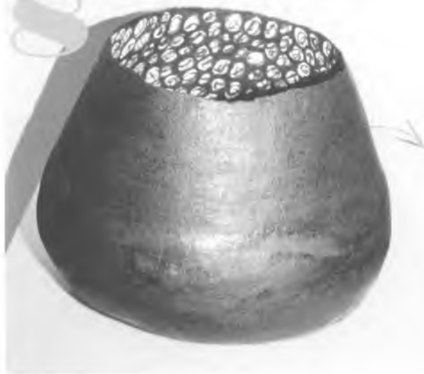
1r premi Ceramista

curs va tenir lloc el darrer dia de la Fira, el diumenge 9 de desembre, a les sis de la tarda i també va registrar força afluència de públic.