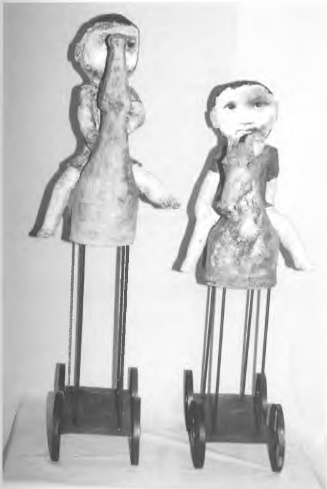
1r premi Noves Tendències

L'acte de lliurament dels premis als guanyadors del Con-