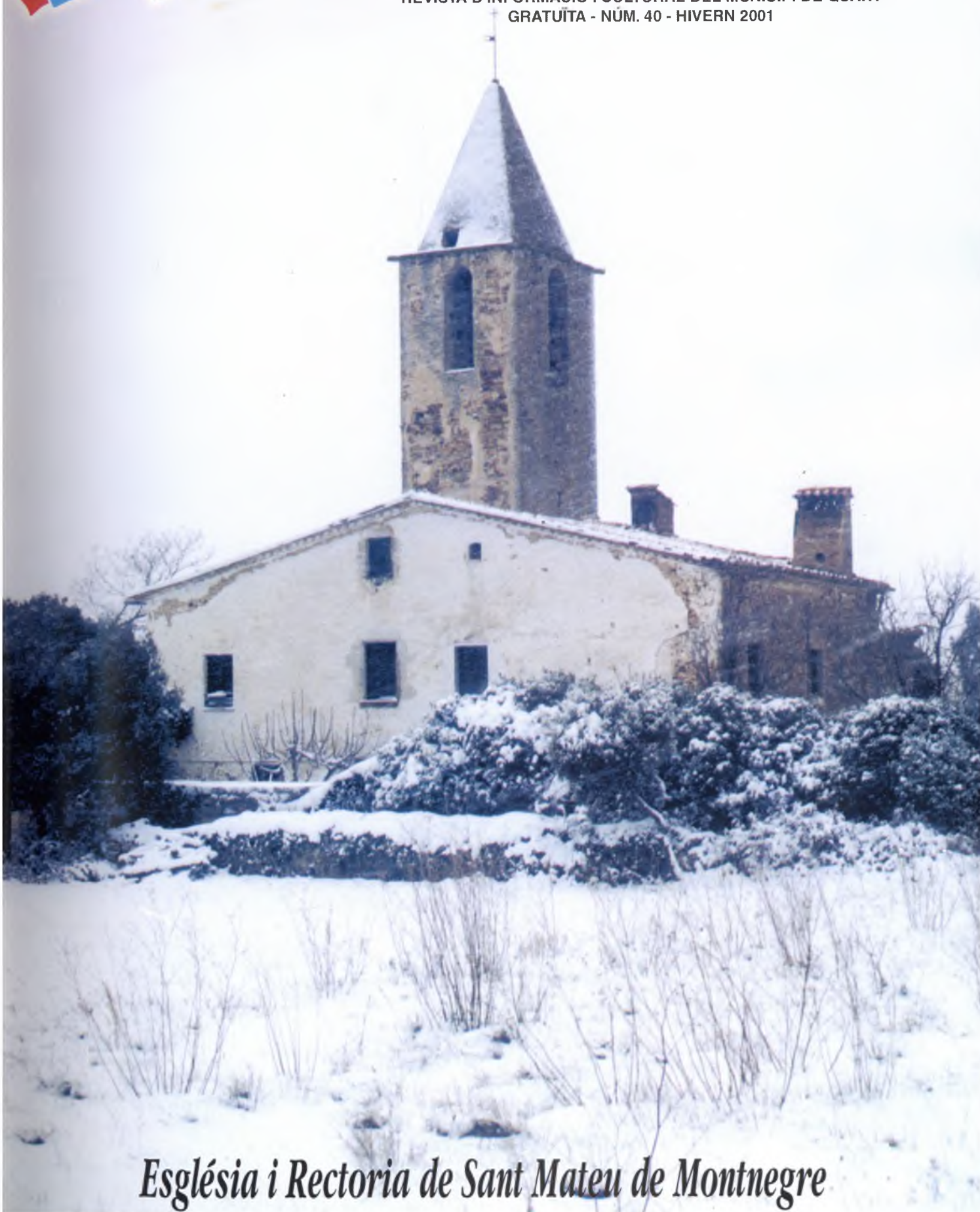
Església i Rectoria de Sant Mateu de Montnegre

REVISTA D'INFORMACIÓ I CULTURAL DEL MUNICIPI DE QUART GRATUÏTA - NÚM. 40 - HIVERN 2001