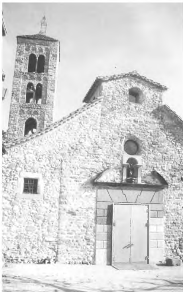
Detall de la façana i el campanar romànic de l'església parroquial de Sant Vicenç de Torelló.

El dia 6 d'abril de 1990, el bisbe de Vic, Josep Maria