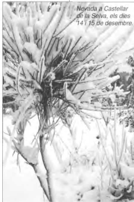
Nevada a Castellar de la Selva, els dies 14 i 15 de desembre.

municipi de Quart i concretament la Fira-Mercat de la Terrissa Catalana i el Concurs de Ceràmica.