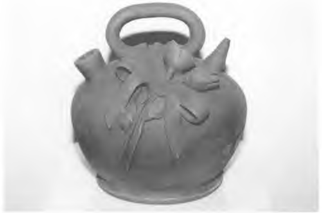
Premi Bonaventura Ansón

El jurat, integrat per Montse Galí, Bonaventura Ansón,