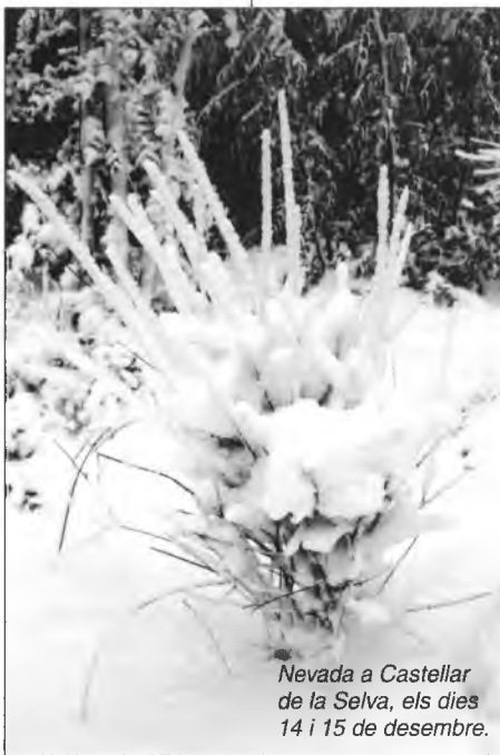
Nevada a Castellar de la Selva, els dies 14 i 15 de desembre.