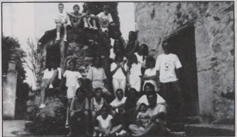
Alguns dels participants a les Colònies d'aquest estiu passat a Sant Martí de Llèmena.

Durant l'últim cap de setmana va augmentar