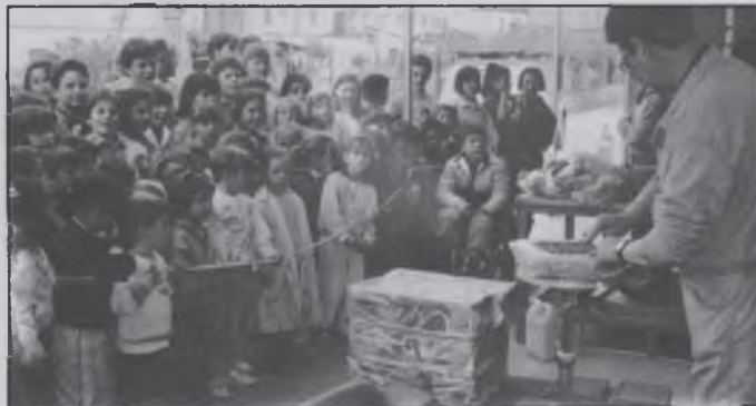
Grup d'escolars observant com es manipula el fang.

Un altre punt molt satisfactori és l'extraordinària bona acollida que ha tingut la iniciativa començada l'any passat, d'enviar als escolars a viure una experiència inèdita per a molts d'ells. Un miler de nois i noies podran descobrir el procés de manufacturació de la terrissa, des de la preparació del fang fins que surt cuita del