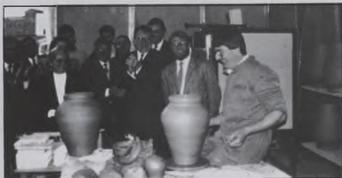
Les autoritats inaugurant la fira passada, mentre un mestre terrisser fa una demostració

A tots, expositors i visitants, els donem la nostra modesta benvinguda i els desitgem una feliç estada aquí... i una bona fira!