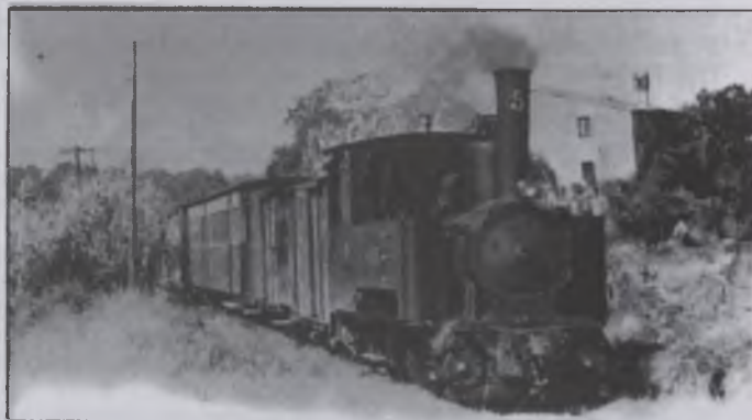
El Carrilet en l'ultima corba entrant a Quart. Al fons, CAL PINXO.

A fi de promoure-ho, els representants dels ajuntaments de Sant Feliu, Castell-Platja d'Aro, Santa Cristina, Llagostera, Cassà,