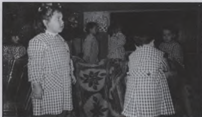
Llar d'Infants La Baldufa

Tant el tió com el rei van arribar a la Llar amb moltes joguines, (contes, jocs, bicicletes, etc.) per als