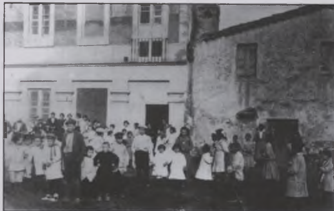
Ajuntament i escola abans de la Guerra Civil.

Educació Secundària Obligatòria: comprén dos cicles de dos cursos cadascun entre els 12 i els 16 anys. Els estudis s'impartiran per àrees de coneixement, tenint en compte la diversitat de necessitats, aptituds i interessos dels alumnes. Donarà a l'alumne una formació professional de Base. Existiran unes matèries