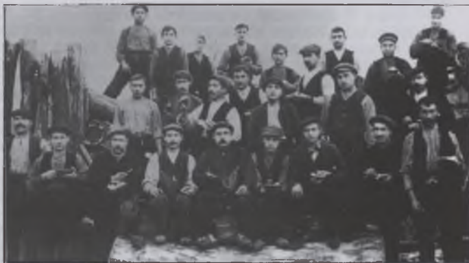
La Brigada de via i obres del Carrilet.

Llambilles, Quart i Girona han constituït un ens jurídic (un consorci), que aplega tots els pobles de la línia, amb capacitat de demanar i rebre subvencions, per adquirir compromisos i pagar les despeses que se'n derivin i per a tots aquells actes que siguin necessaris per