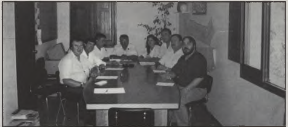
Constitució del nou Consistori Municipal

El percentatge de participació és un dels més alts de totes les comarques catalanes, inclús de tot l'estat, ja que suposa el 77,18% dels Cens Electoral format per 1.411 electors. L'abstenció per tant fou solament el 22,82% del cens, abstenció que podem considerar baixa ja que els polítics consideren que el percentatge del 30% d'abstenció és l'acceptable i normal en unes eleccions.