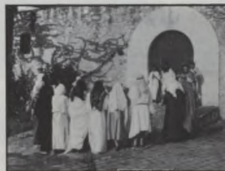
Escenes de la Passió a càrrec dels grups del Casal de Palol, realitzades entorn del castell de Palol d'Onyar