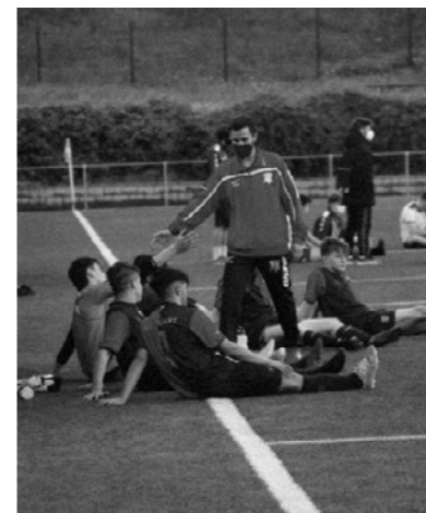
Jugadors i tècnics de l'equip cadet de preferent de la UE Quart fent estiraments després d'un partit.

Tot plegat, ha estat un situació molt complicada, un malson, que esperem que passi ben aviat.