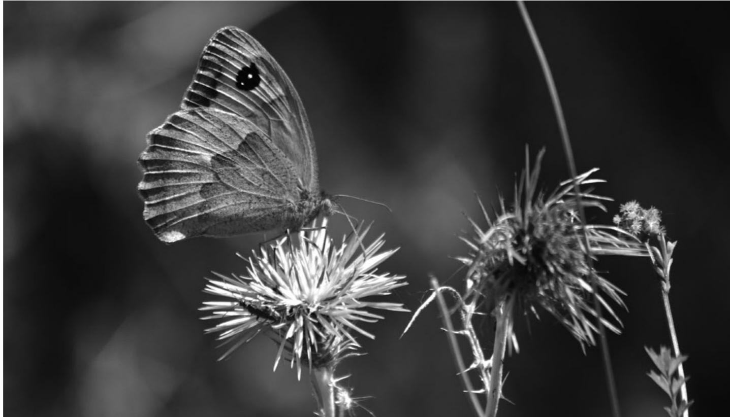
Bruna de prat Maniola jurtina