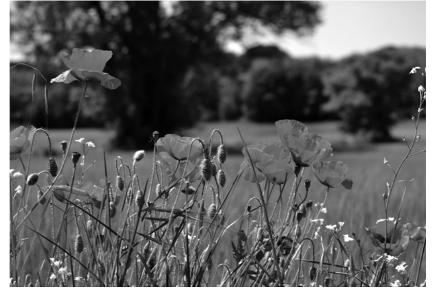
Roselles als marges dels camps Papaver rhoeas