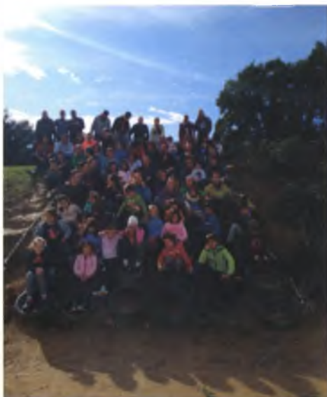
Alumnes de 5è