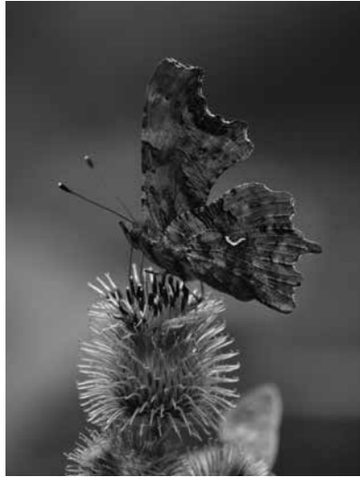
Papallona de la c blanca Polygonia c-album

Una altra espècie que podem observar al començament de la primavera és la papallona de la c blanca , que es deixa veure en zones humides com a l'entorn del Celrà i l'Onyar. És inconfusible per les ales retallades, i com el seu nom indica, té dibuixada una c de color blanc a la part posterior de les ales.