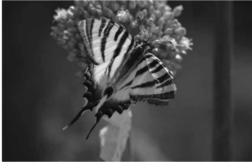
Reina zeburada Iphiclydes feisthamelii

També comencem a veure unes papallones espectaculars per la seva mida i disseny, la papallona reina i la reina zeburada , aquesta última lligada als ambients agrícoles amb fruiters i als matollars amb aranyoner i arc blanc. Per això, és freqüent veure-la als camps que envolten el municipi, tant a la Creueta com a Palol d'Onyar i Quart. En canvi, pel que fa a la papallona reina, els mascles es concentren als turons i a les carenes, on lluiten entre ells amb vols acrobàtics