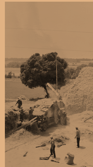
Treballant al costat del lledoner