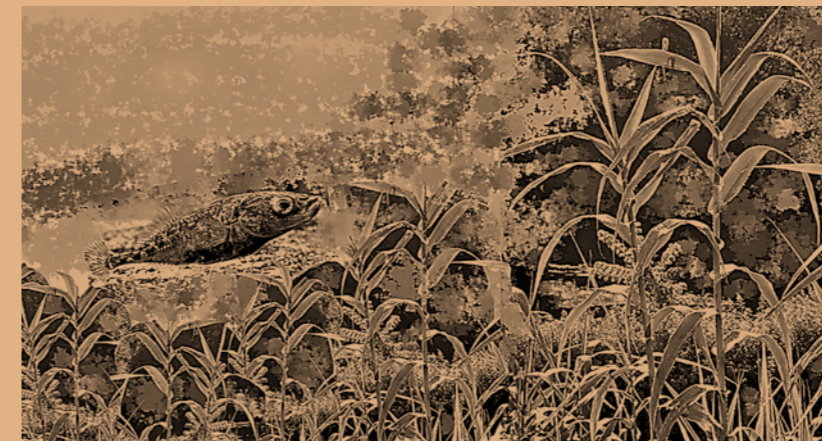
Il·lustració: Il·lustració: Kunsep MJ, 2021

L'espínós feia el mirallet i tot el canyer retransmetia l'espectacle.