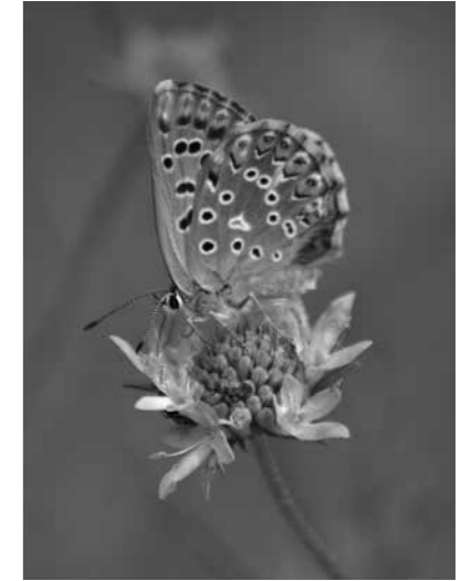
Blaveta comuna Polyommatus icarus

Tot i així, podem dur a terme algunes pràctiques que poden ajudar al fet que les papallones i els insectes en general no desapareguin. Per exemple, no utilitzar insecticides ni als camps de cultiu ni als jardins particulars. També és molt impor-