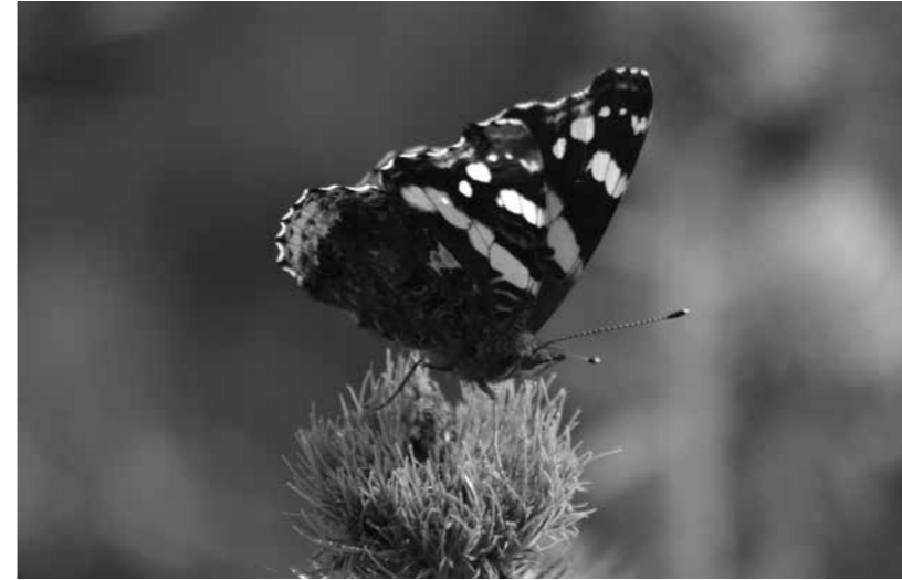
Atalanta Vanessa atalanta

Tenim papallones que si les condicions són favorables les podem veure des de finals d'hivern fins ben entrada la tardor, tot i que els mesos d'estiu és quan en veiem un major nombre. Aquestes són la cleòpatra , una papallona de color groc i taronja en el cas dels mascles, i groc en les femelles, que conviu i es confon sovint amb la llimonera. La podem trobar tant en matollars, com en