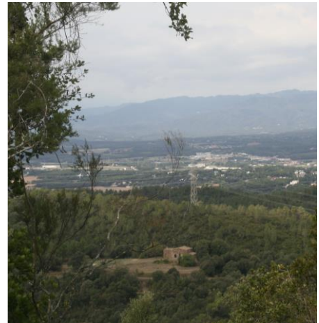
Foto de Can Bertran dels Àngels

Una mica més avall de can Bertran es pot observar la famosa figura del bisbe estirat coronat per el castell d'Empúries a tocar de la costa.